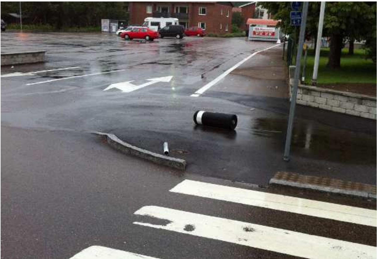
Vass och farlig kantsten. Lägg märke till den nerkörda stolpen. Så har det sett ut mer än en gång sedan ombyggnaden.

Dessa avsmalningar bör fortast möjligt tas bort. Dom hjälper ingen och har bara visat sig skapa osäkerhet och otrygghet.