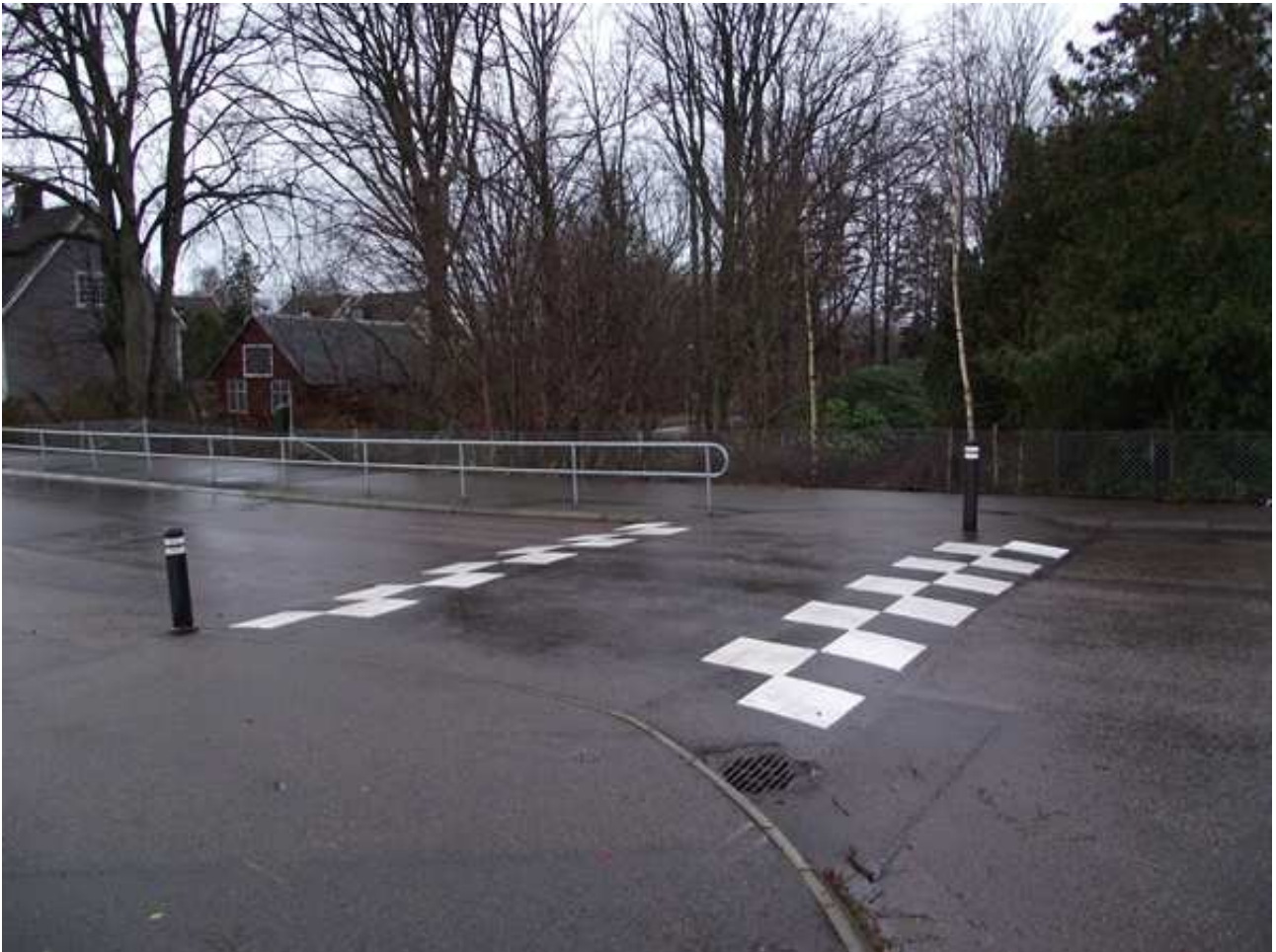
Övergång som skapar osäkerhet.

Sätt upp skyltar och markera i vägbanan för övergångsställe.