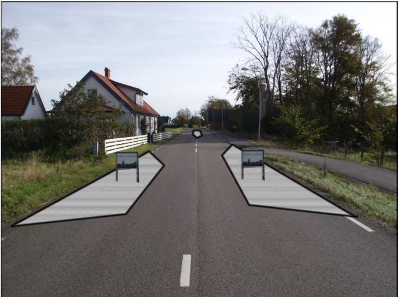
Förslag på fartdämpande åtgärd vid Ängelholmsvägen

Anlägg en avsmalning direkt öster om Bojevägen med ett övergångsställe. Så får man ett hinder till så farten inte ökar innan man når avsmalningen vid Lyckgatan.