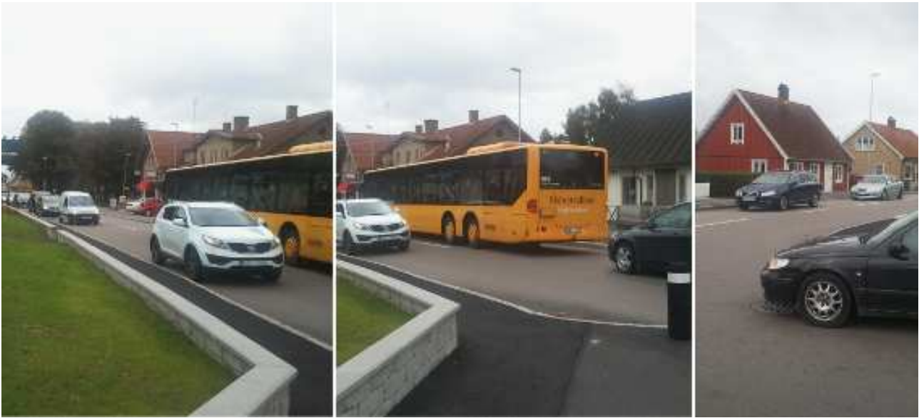
Så här ser det ofta ut när bussen stannar mer än en minut vid hållplats "Nygatan".

Förslagen är många på hur det ska lösas. Men en genomgående åsikt är att det ska göras riktiga bussfickor här. Det borde vara en självklarhet vid busshållplatser där man ska vänta in tidtabellen.